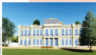
Château de Vitry en 3 D.