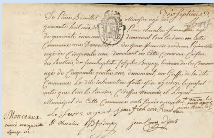
Acte de décès établi le 3 floréal de l'an IV (22 avril 1796) au lendemain de l'assassinat.

Le mardi 6 octobre à 18h30 Conférence d'Élise Lewartowski des Archives départementales du Val-de-Marne : "Les châteaux disparus du Val-de-Marne" Inauguration à partir de 19h30