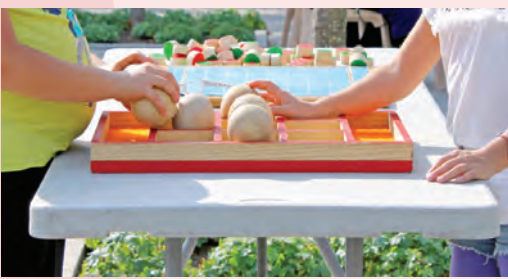
Jeux en bois.